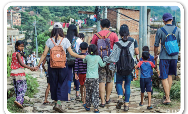
▲ 陪孩子走完教育之路

在尼泊爾的廓爾喀以及世界上許多地方，貧窮是延續上百年的循環。而教育正是打破貧窮循環的方式，給兒童一個改變自己的機會。