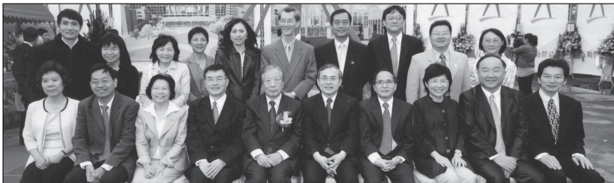
※ 臺大社科院新建大樓工程動土典禮合影

最後，陳教授說，社科院遷建的路，一路走來很辛苦，全靠團隊的努力才得以完成。他的想法很單純：只為公共利益、不為私利，只希望臺大學生未來發展得更好、走的路更加寬廣！（陳正倉教授為臺大經濟系1972畢業系友）