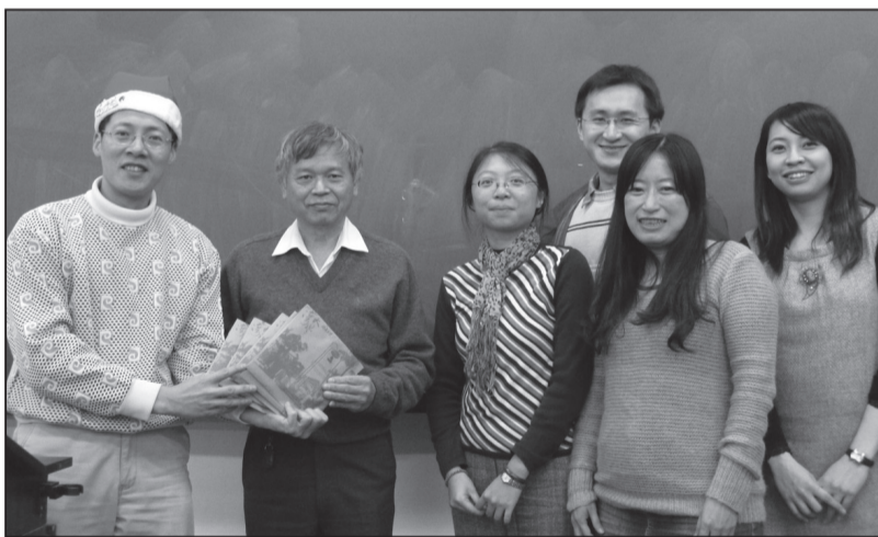
※ 本系在職專班上課情形與課外活動