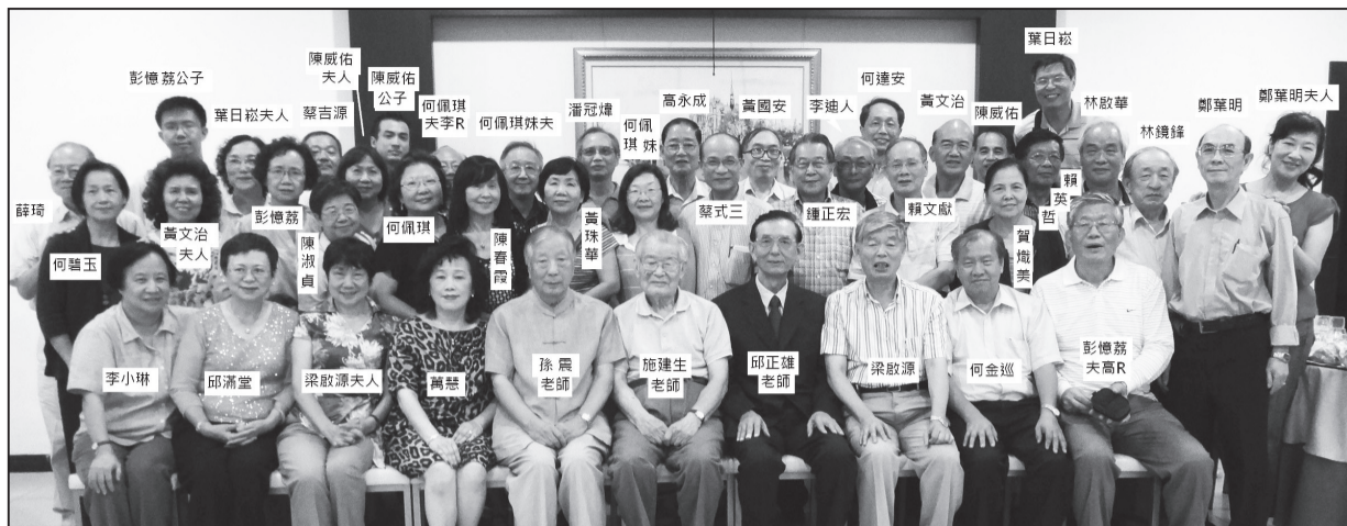
※ 鍾正宏系友與教授、同學之大合照

世界經濟危機，激發了他不認命的性格，去面對挑戰和找尋圓夢的可能性，也使得一間由三人起家的小公司，一路跌跌撞撞、歷經大風大浪，到現在集團穩健成長。